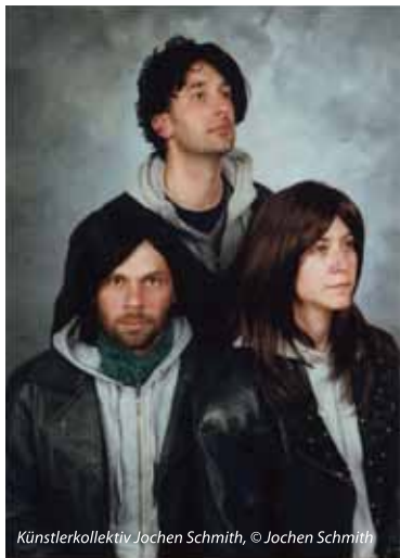
Künstlerkollektiv Jochen Schmith, © Jochen Schmith

Drei Künstler verbergen sich hinter dem Kollektivnamen „Jochen Schmith“, das aktuell Preisträger des Aufenthaltsstipendiums in der Villa Concordia ist. Am 19. Oktober um